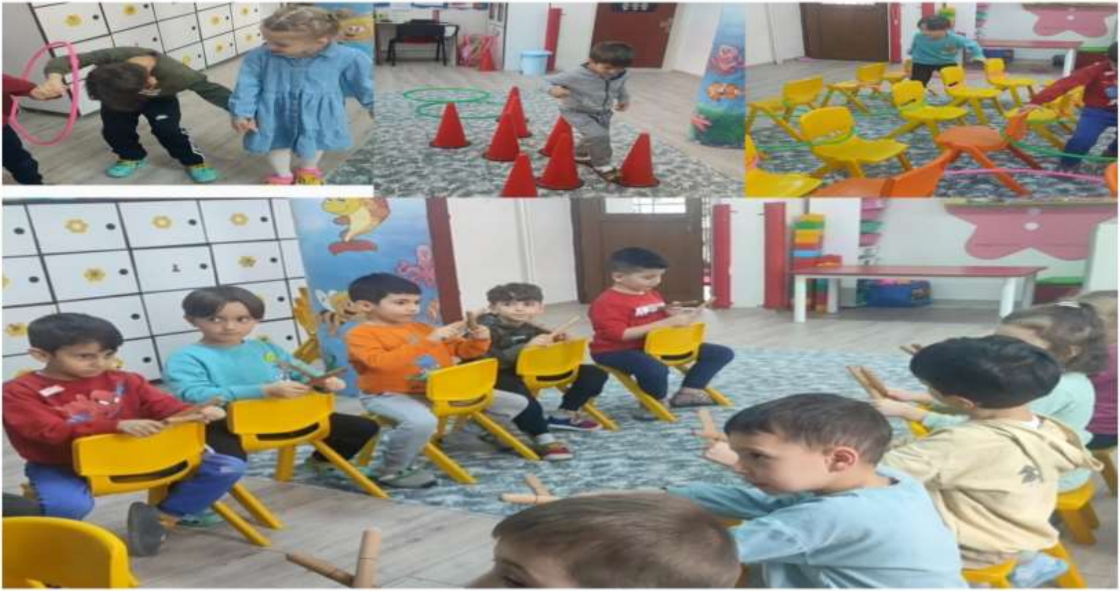
RİTİM ÇALIŞMASI VE YARIŞMALI PARKURLAR