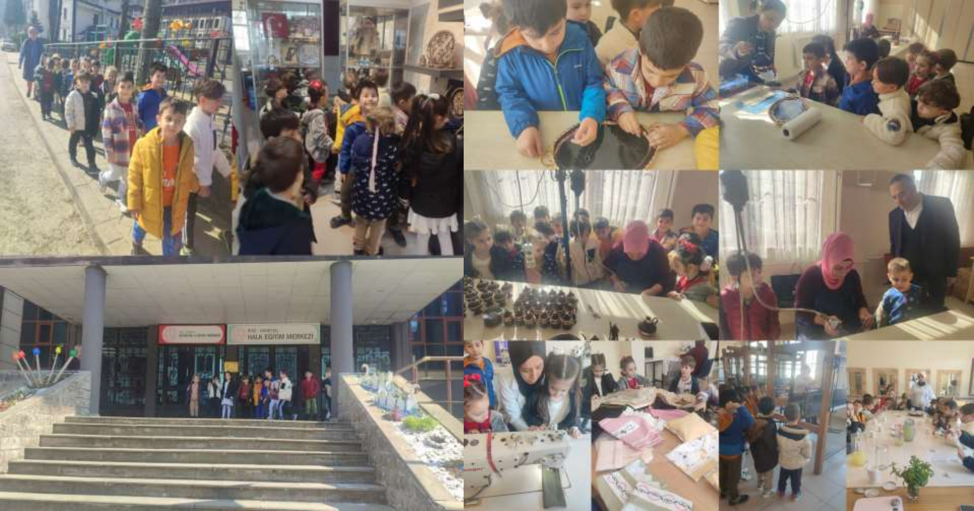
HALK EĞİTİM MERKEZİ GEZİMİZDEN