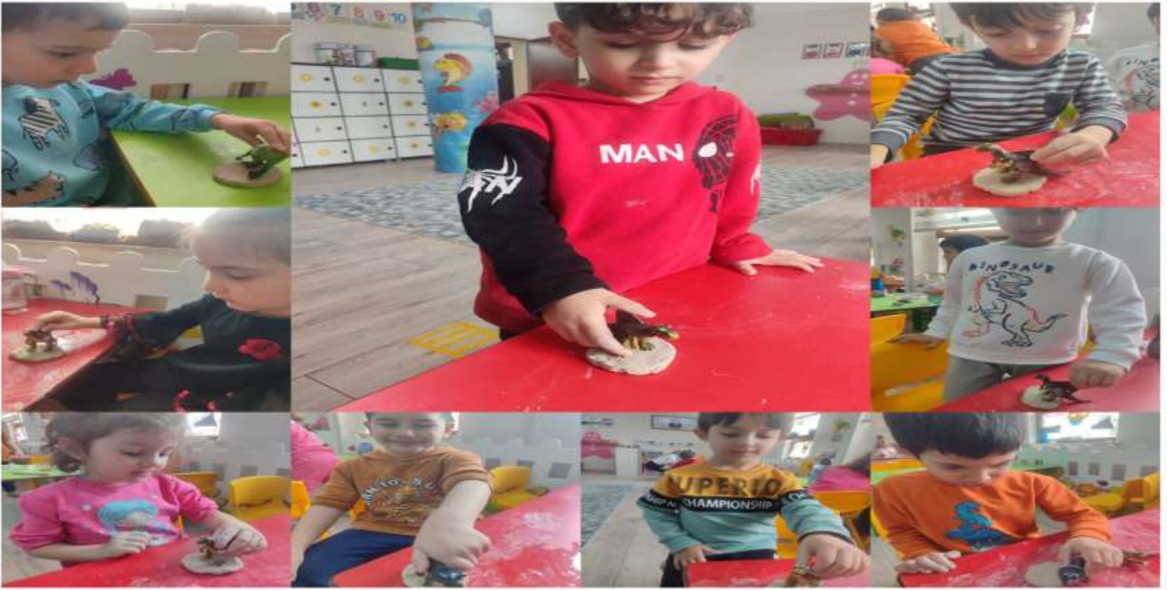
KIL HAMURU ÇALIŞMASINDAN , DİNAZOR FOSİLİ