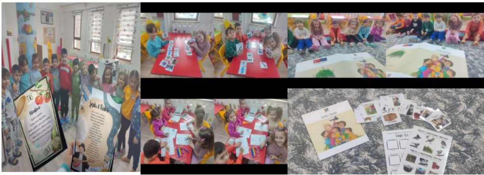
DİLİMİZİN ZENGİNLİKLERİ KAPSAMINDA YAPILAN ÇALIŞMALAR