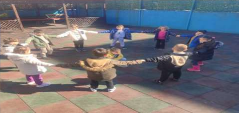
SINIF DIŐI ETKİNLİKLERİMİZ