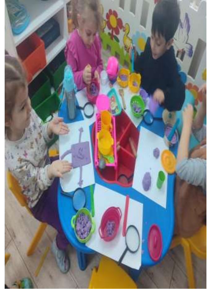
ISINMA ÇALIŞMALARIMIZ VE OYUN ETKİNLİKLERİMİZ