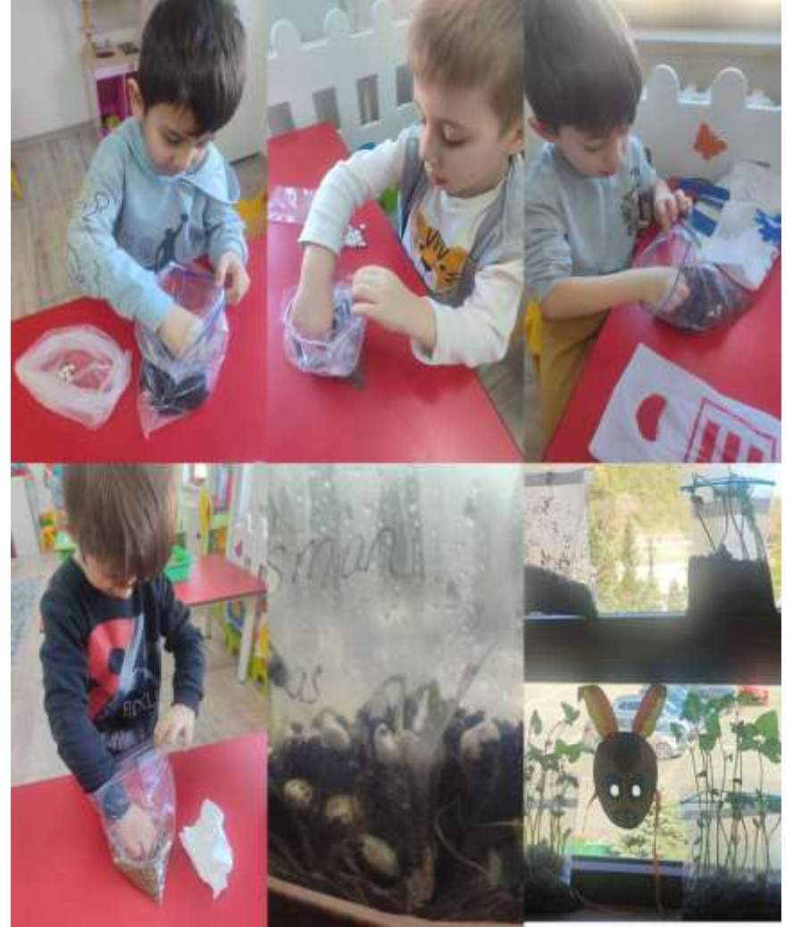
FASÜLYE EKİYORUZ, FİLİZLENİYORUZ