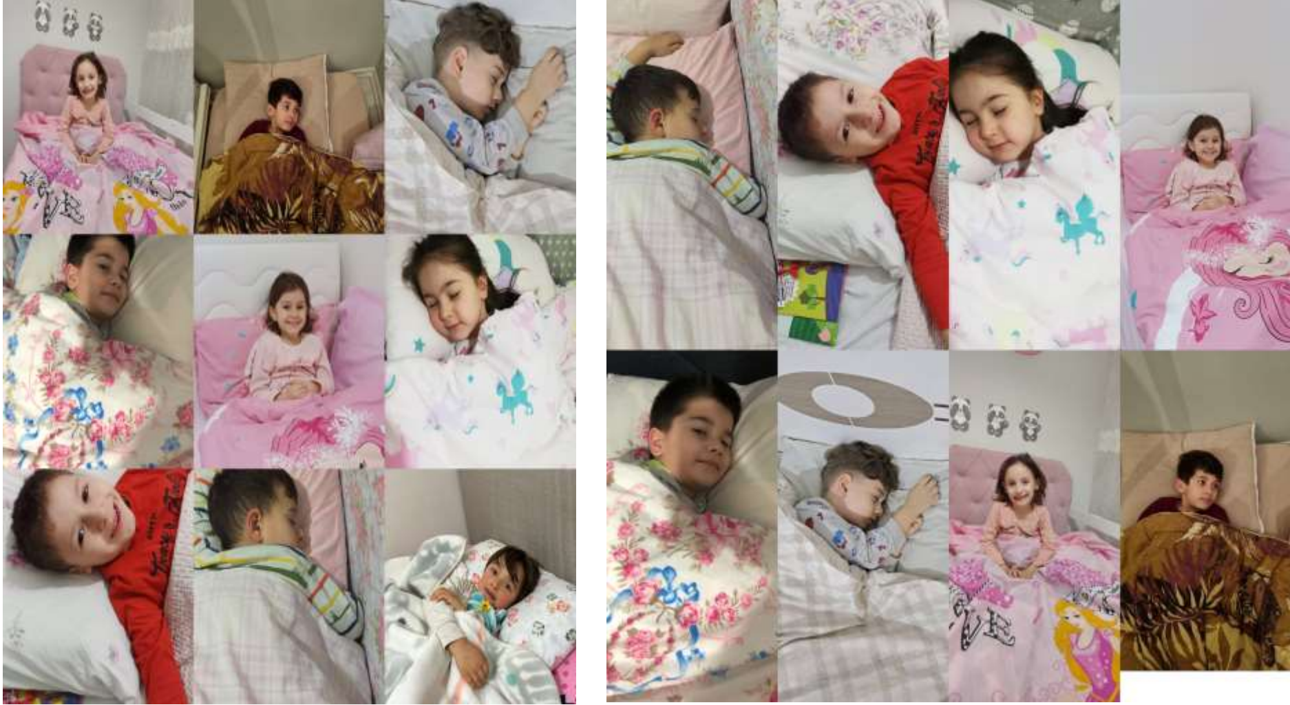
UYKU SAATLERİMİZE DİKKAT ET ÇALIŞMASI