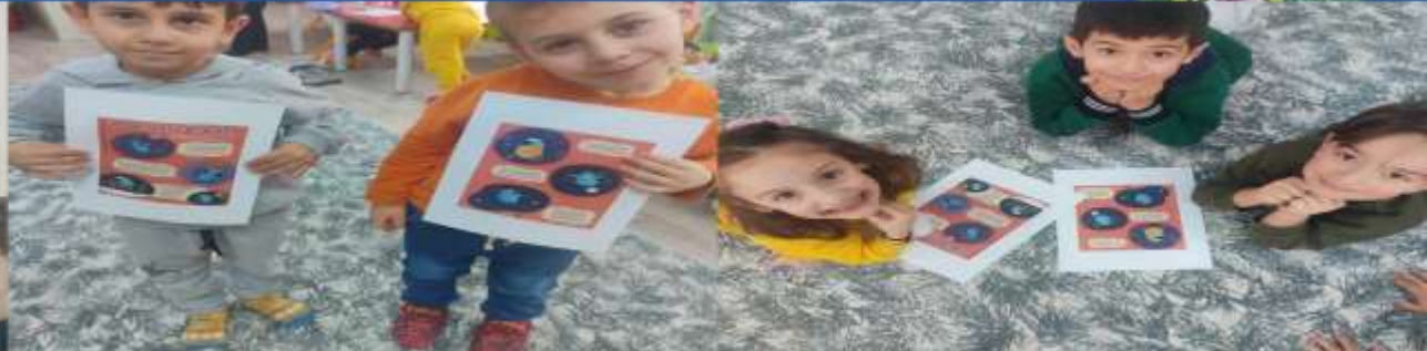
UZAYA YOLCULUK PROJESİ ÇALIŞMALARI