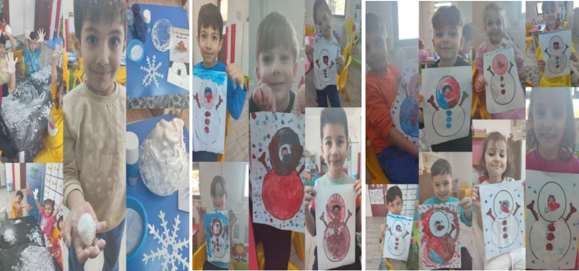
KIŞ MEVSİMİ, YAPAY KAR YAPIMI VE KARDAN ADAMLARIMIZ